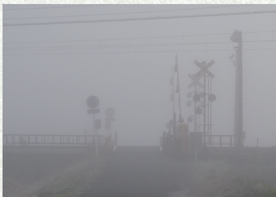
東武日光線 東武動物公園・杉戸高野台間

霧切は記憶を食べる 灯りは消えたまま 誰も待たない 列車の来ない その去る瞬間 過ぎた呼び声 誰かが配はる 空気が残っている 霧の奥に 名もなき声 沈んでいく 沈黙を守っている