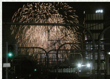
JR京浜東北線 赤羽・川口間

ドドーン 夜が照らされる。 いつも違うホームの姿。 彼女の浴衣がほのかに染まる。 「撮れたこと聞く君 「まあまあかな」本当は自信作。 ヒューン。火花の色に染まりながら、 滑り込んできた電車にのせられて 歩き始める。 彼女の笑顔。 夜空を照らすまん丸い火花。 笑い声がホームから去る電車をみて言う。 「また来年も、見れるといいな。」