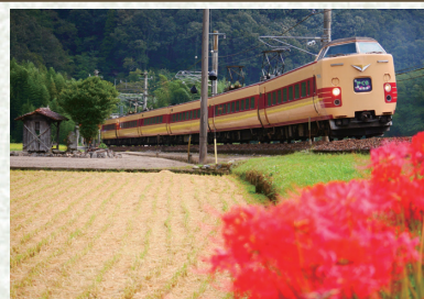
JR伯備線 備中川面・方谷間

憶えたての手順で慎重に、 肌色のクリームを塗っていく。 眠れないまま夜を明かしたことが 悟られないよう、目元にも気を配る。 眉を整え、頬に紅を挿すと、 顔にはわりと明かりが灯る。 扉を開けたら秋の風 颯爽と、タタタタタンと。 真つ赤な線香花火へまっしぐら。