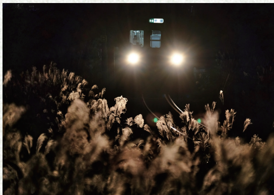
大井川鐵道 福用・大和田間

すすき揺れる 秋の影ライトに映る 駅灯のきりのホーム 風の車過ぎ 銀色の穂が揺れる 夜消える 星ひとつ光る 夜のあとさき 夜が明けて 新しき光まり 朝露に輝き 希望満ち