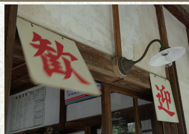
山形鉄道フラワー長井線 羽前成田駅

無人駅を風がわたる 多くの旅びとが荷物をおろし 軽くなったところを吹き抜けていった 雄踏でふと頬を撫でる風に あの時の匂いがした そっだ。 旅に出よう。