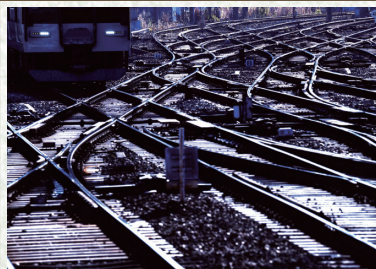
近鉄 大和西大寺駅

進むべき道がわからない私 ゆく先見えず ひとり佇む 誰か教えてくれ でも 誰もわからない 運を委ねる あみだくじ すべてを得るか すべてを失うか 進むべき道を見失った私 不安と恐怖 ひとり固まる 誰か導いてくれ でも 誰も頼れない 運を委ねる あみだくじ 天に昇るか 地獄に落ちるか