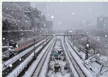
JR中央線 飯田橋・市ヶ谷間

雪が降る 喧騒を沈め 音を消す 穢れを清め 東京に雪が降る 行き交う人はみな親し気だ 「東京はさみしい」 いつか君が別れ際につぶやいた言葉だ 静かに 雪が降る 街を眠らせ 雪が降る 君のいない東京に 雪が降る