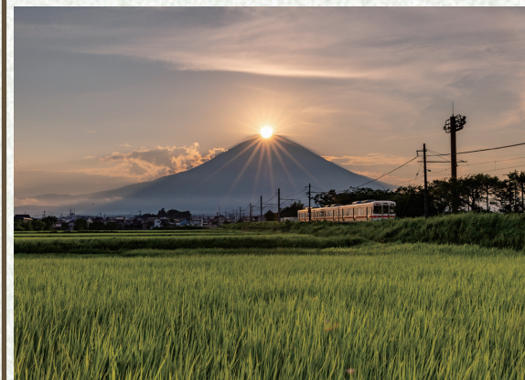
JR御殿場線 御殿場・足柄岡

「暑い夏に」 塩川里美（静岡県） 歴史上最高に暑い夏が来るらしいよ 山に行こうか 海に行こうか 君と一緒になら 僕史上最高にあつい夏になるよ きつとね